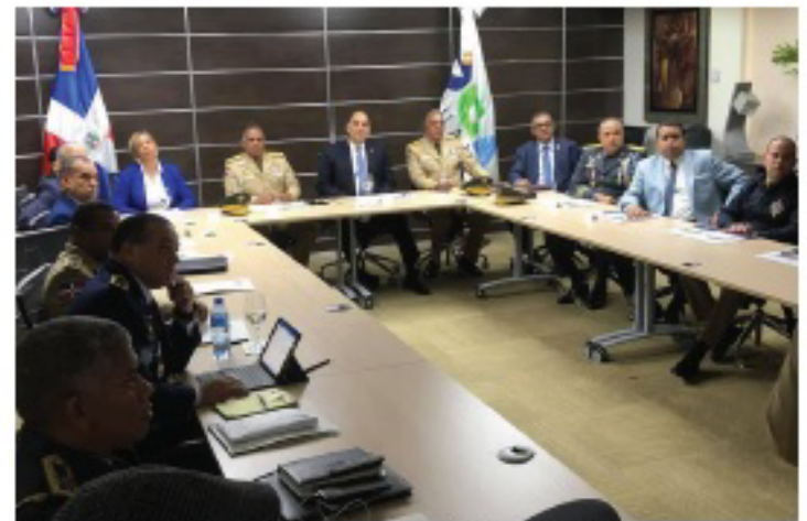
Las instalaciones de Carrizal se inaugurarán este jueves 6 de junio.

En la firma del protocolo de acción estuvieron los representantes y titulares de los ministerios de Salud Pública, Agricultura, Medio Ambiente y Recursos Naturales, Procuraduría General de la República, el Ejército, DNI, DNCD, Policía Nacional y Dirección General de Migración, entre otros.