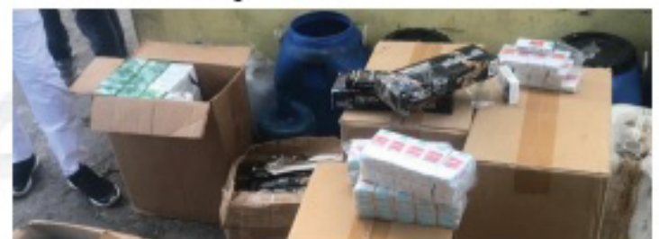
En el hallazgo se incluyen 24 botellas de whisky Peter Allen, posiblemente falsificado, 4 galones y 24 garrafones, presumiblemente, de alcohol etílico o clérén.