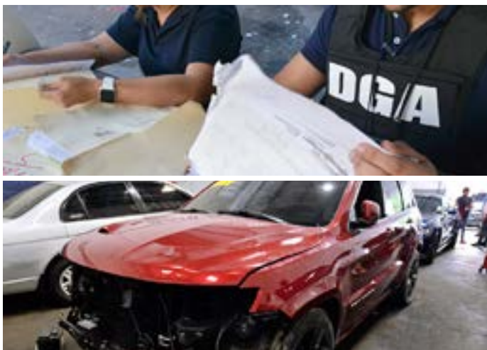
Fue una operación conjunta entre el Ministerio Público, Aduanas, la Policía Nacional, la DICAT, el DICRIM y el ICE de los EE.UU.

En febrero se ejecutó un operativo simultáneo en diferentes puntos de la ciudad, en el que participaron organismos de seguridad del país y de Estados Unidos, en torno a una supuesta red dedicada a la falsificación de documentos y alteración de procesos aduanales, con el fin de introducir vehículos no aptos para circulación, por estar catalogados como desechos, y otros para evadir el pago de impuestos.