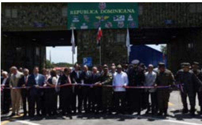
El Centro de Gestión Coordinada de Fronteras Carrizal promueve la participación del sector privado como zona de inversión y desarrollo, motorizando las oportunidades de progreso y crecimiento.

El 5 de junio quedó inaugurado el Centro de Gestión Coordinada de Fronteras Carrizal, en Elías Piña, una apuesta de la Dirección General de Aduanas, de la mano del Ministerio de Defensa, por la humanización y ordenamiento de las labores migratorias y el comercio transfronterizo, en consonancia con los parámetros de la Organización Mundial de Aduanas. Actualmente desarrolla las mismas labores en Jimaní.